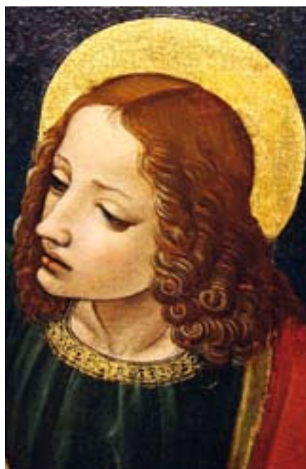
■ Der Evangelist Johannes, Meister von San Rocco at Pallanza, 15. Jh., Museo del Paesaggio, Verbania.

Obwohl schon früh Zweifel an dieser Gleichsetzung laut wurden, folgte die christliche Tradition lange der Vorstel-