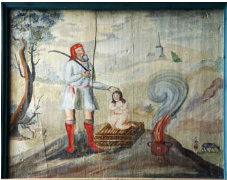
■ Die Opferung Isaaks – dargestellt in einem Emporengemälde in der Laurentiuskirche im fränkischen Muggendorf, nach einer Vorlage von Matthäus Merian, 1688.