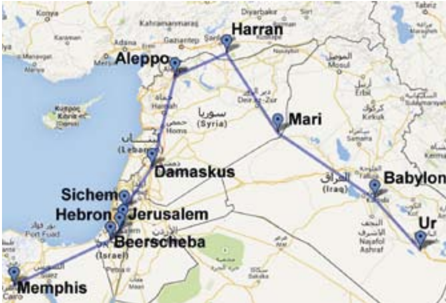
■ Die Reiseroute Abrahams führt von der Stadt Ur über Babylon und Aleppo nach Ägypten und zurück nach Kanaan.

Grat: Joachim Schäfer / Ökumenisches Heiligenlexikon