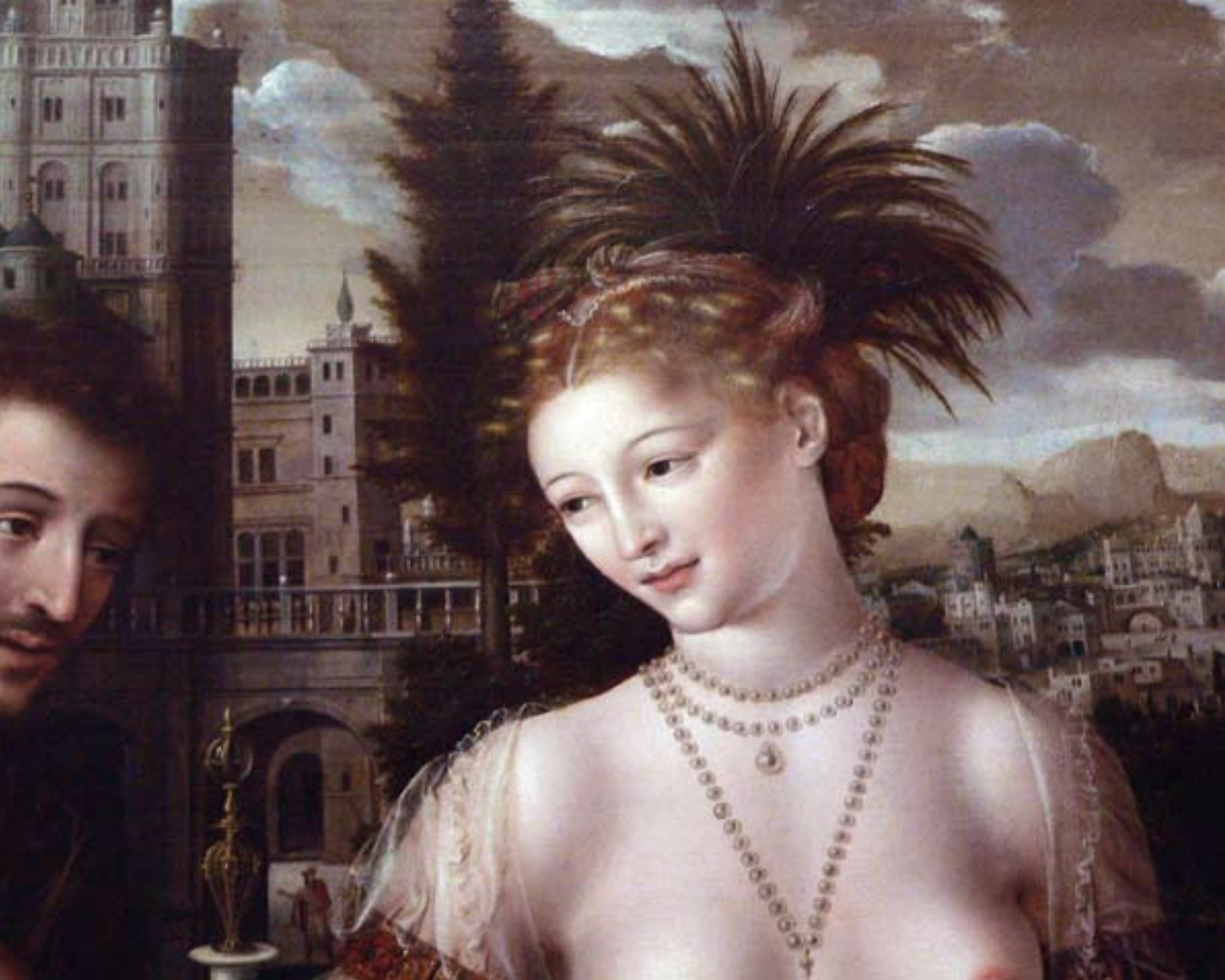
■ David und Batseba, Jan Massys, 1562, Louvre, Paris.