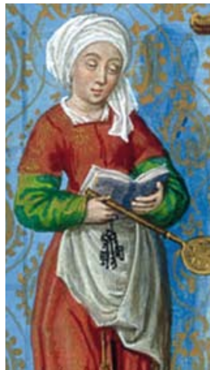
... Marta machte sich viele Sorgen..

Auch in der nun folgenden Vätergeschichte ab 1. Mose 12 bleibt dieser Ansatz bestehen: keine in den Himmel gehobenen Erfolgsstorys, sondern Geschichten von Menschen, die an ihrem Tiefpunkt noch eine Zukunft haben. In den Abgründen des Lebens, im Scheitern, in Schuld und Versagen ist Gott ihnen nahe. Auch wenn alles verquer geht bei Abraham, Isaak und Jakob – es gibt eine Hoffnung und eine Verheißung. Diese Linie zieht sich durch die Biografien der Bibel bis zu Jesus, den Gott aus dem absoluten Tiefpunkt, dem gänzlichen Scheitern im Tod, zum Leben erweckt.