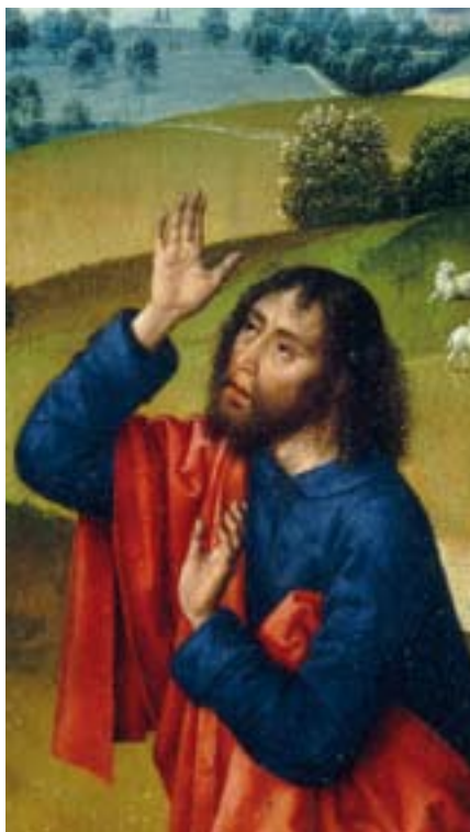
... Moses stotterte ...

Es beginnt mit Adam und Eva. Schon mit den ersten Menschen läuft nicht alles nach Plan. Oder doch? Beschreibt die Vertreibungsgeschichte vielleicht die notwendige Emanzipationsgeschichte des Menschen von Gott? Findet der Mensch seine eigentliche Bestimmung erst als Gegenüber